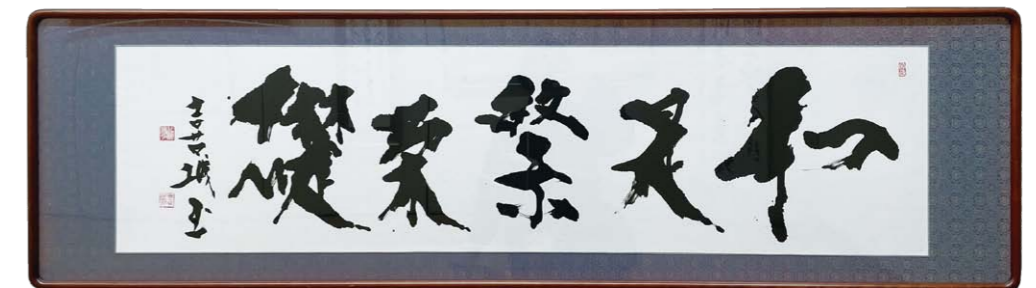
過去に開催されたねんりんピックへの青森県出品作品