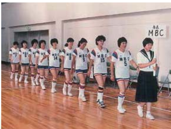
第1回 全国家庭婦人バスケットボール交歓大会