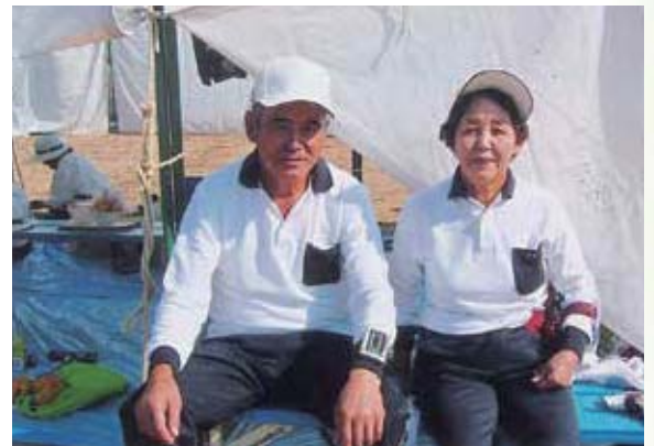
十和田チームの選手と

グラウンド・ゴルフを始めて体調が良くなったことから、健康はスポーツ活動を続けることと考え、ダンス、水泳にも力