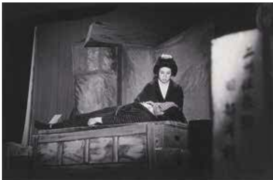
19歳ではじめた演劇

家にこもらないように、一人でもどんな色々なものに参加し、腰や膝が痛くなっても動かしていれば大丈夫、とじっとしていかない。いつまでも好奇心をもって行動していることで、次の好奇心の元が生まれている。「私は人に恵まれているから、少しでも恩返しをしないとね」とおっしゃる姿勢が元気の核になっているようだ。