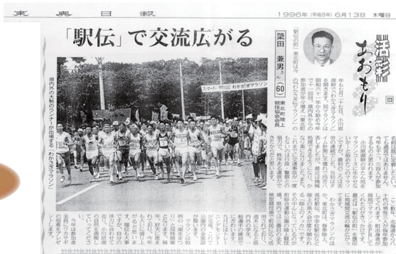
東奥日報：1996年6月13日掲載

交通安全関係については、昭和63年、交通安全功労賞、平成21年に交通安全功労賞、平成26年に東北管区警察局長、平成28年に青森県知事表彰・交通安全功労賞に輝いた。交通安全のほり旗を自ら運び、地域のためにと献身的だ。