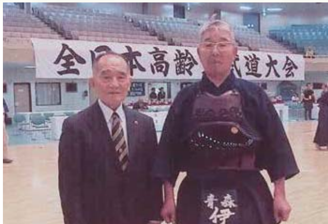
平成30年6月 全日本高齢者剣道大会にて (右側)