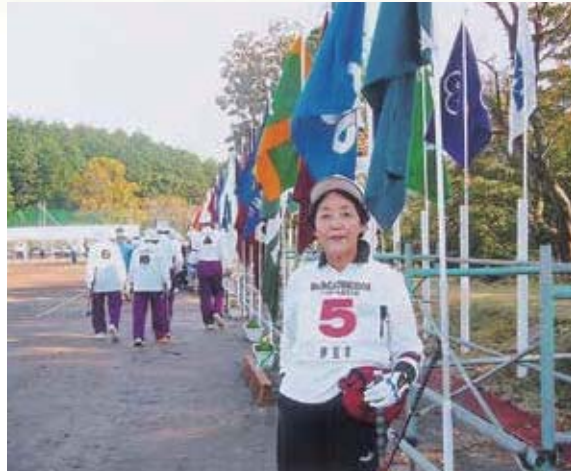
ねんりんピック静岡でゲートボール交流大会に出場

を入れるようになりました。そのうちゲートボールにも参加するようになり、以来28年間続けています。市老連の役員も務めるようになり、活動の分野が広がり行動も広くなったことで体力もつきました。