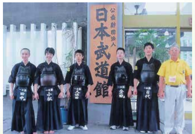
全国道場少年剣道大会 県代表の教え子と