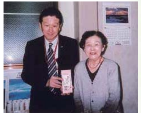
取引先の郵便局長さんと

趣味は習字。事務所の掛け軸には見事な習字作品が飾られており、ミツさん100歳の記念に息子さんが習字の作品を一筆箋にして取引先の方へお土産に差し上げています。「料理やおにぎりを持ち寄り、にぎやかに友達と過ごす時間は格別です。」と、毎週土曜日に集まっている仲良し15人グループが、3人になりましたが今でも続けています。先日は100歳到達のお祝いとして総理大臣からもらった銀杯や賞状を見せたそうので、嬉しかったでしょうね。