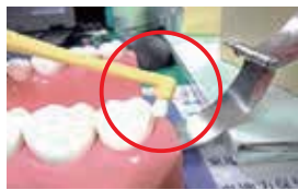
部分みがき用歯ブラシ (ワンタフトブラシ)