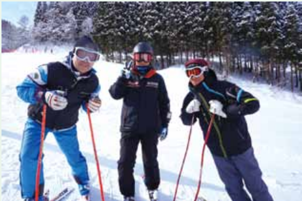
エンジョイスキー！