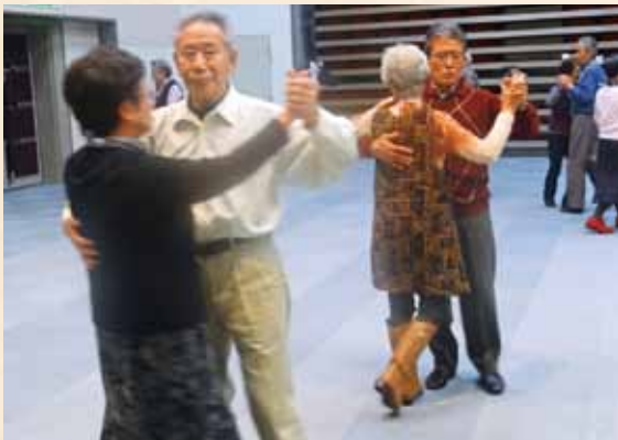
みんなで社交ダンス