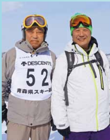
スタート前の様子

シニアスキー交流大会は、滑走を楽しみながら、誰にでも優勝のチャンスがある大会です。速さだけではなく、申告のタイムに、より近いタイムで滑走する正確さが重要です。 20年位昔は、80歳を超えてのスキーはまれでした。現在のマスターズの大会では、85歳以上でも20名を超える選手が意気揚々滑っています。いかに寿命が伸び、元気がわかります。みな大会に向けて、トレーニングを行い、どんどん健康になっています。スキー人口は減少していますが、高齢者のスキー人口は増加しています。 この大会はタイムを考えるといい結果は出ません。参加の際はスキーをエンジョイしましょう!!