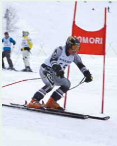
勢いよくコーナーへ