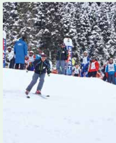
皆の声援を後にスタート！！