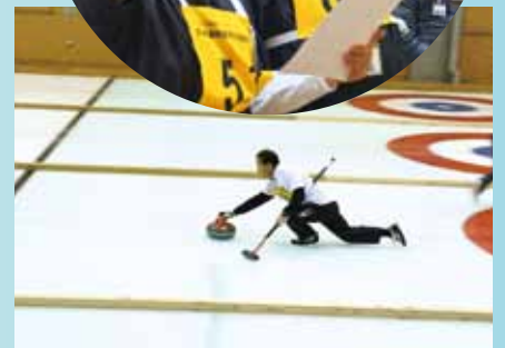
きれいなフォーム