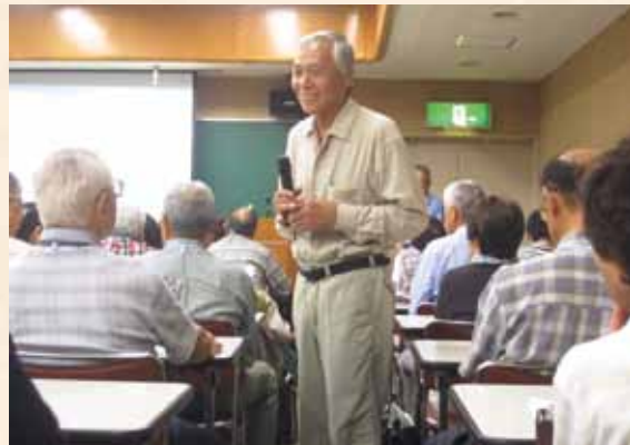
白神の自然・マタギとは

今年のシニアカレッジ、「学ぶことは、無限の広がり と奥の深さがある・・・。」と学長の言葉に生かされ、 やる気满满でスタート。