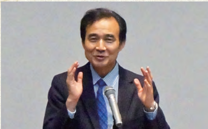
青森大学学長・崎谷康文氏