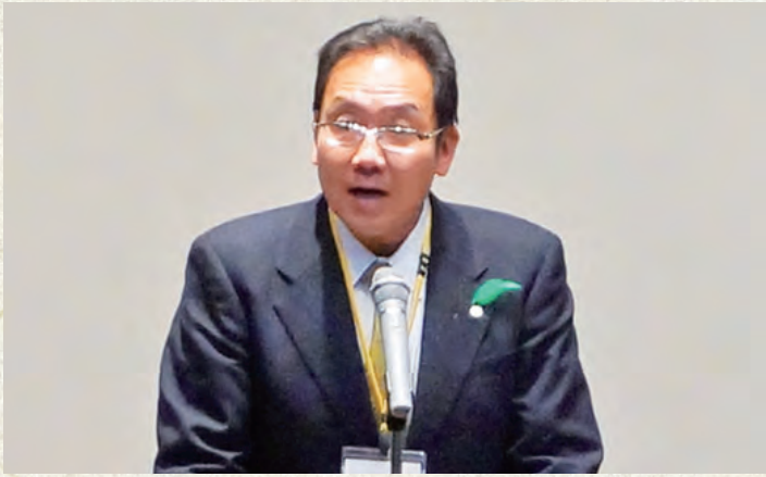
青森県健康福祉部・江浪部長挨拶