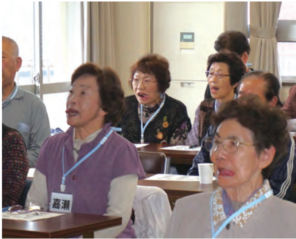
おいしく食べる為に舌の運動も！右・左・ペー

り一層質の高い生活を営んでいくために、生涯を通じての歯の健康づくり、口腔機能の向上が重要になってきているのです。青森県長寿社会振興センターの事業のひとつであるシニアカレッジ。ここでも7月に口腔ケアについて講義が予定されています。 『口は命の扉』。人生、最後の最後まで自らの口で好きなものを食べて、健康に気持ちも豊かに過ごしていきたいものですね。 (取材・文 山谷路子)