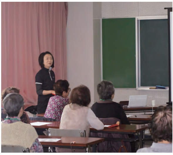
目標は30回以上しっかり噛んで健康アップ

海と山に囲まれ、豊かな旬の食材を楽しめる青森県。幾つになっても美味しいものを美味しいと感じながら、楽しい毎日を送りたいものですね。