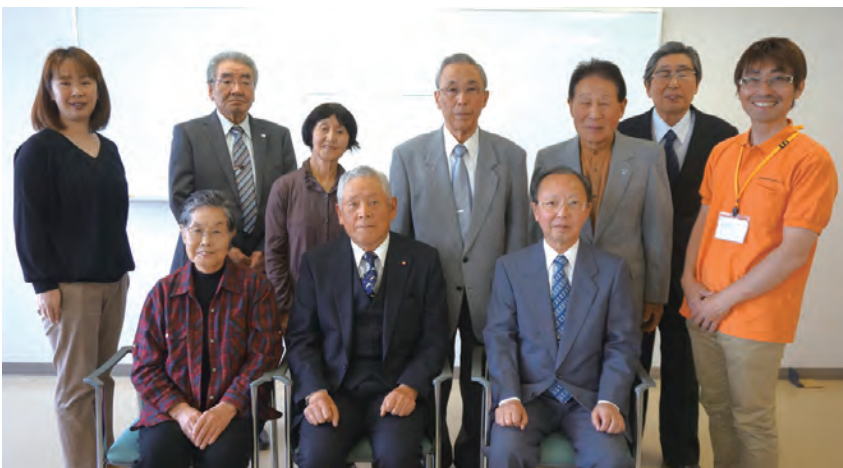
第1回編集委員会出席の皆さん（5/22）

今年度は、私たちが年4回発行の機関誌「あすなる倶楽部」の内容検討、記事執筆、校正などを担当します。 県内の生きがいづくり、健康づくり、仲間づくりに取り組み団体や個人を、皆さんにご紹介していきます。宜しくお願いします！