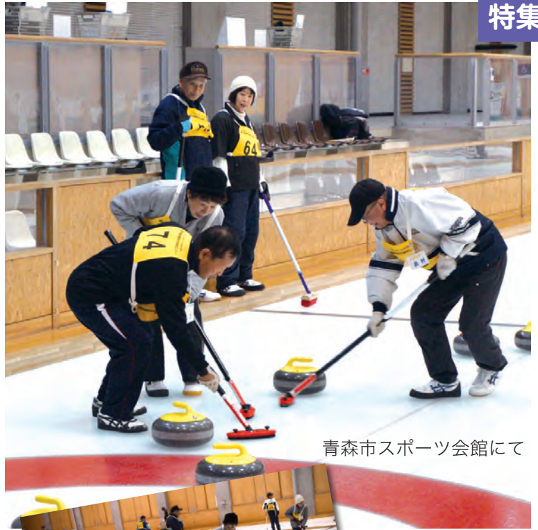
青森市スポーツ会館にて