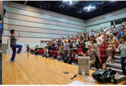
シニアアップ講座