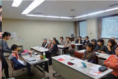
カラーコーディネート講座

青森シニアカレッジは、シニア世代に必要な教養を身に付けるとともに、レクリエーション活動や社会活動を通して心身の健康保持を図り、生涯現役で活躍することを目的としています。 受講生は『私たちのめざす学校』として次のことを掲げ、今年一年受講してきました。