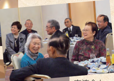
交流会も大盛り上がり