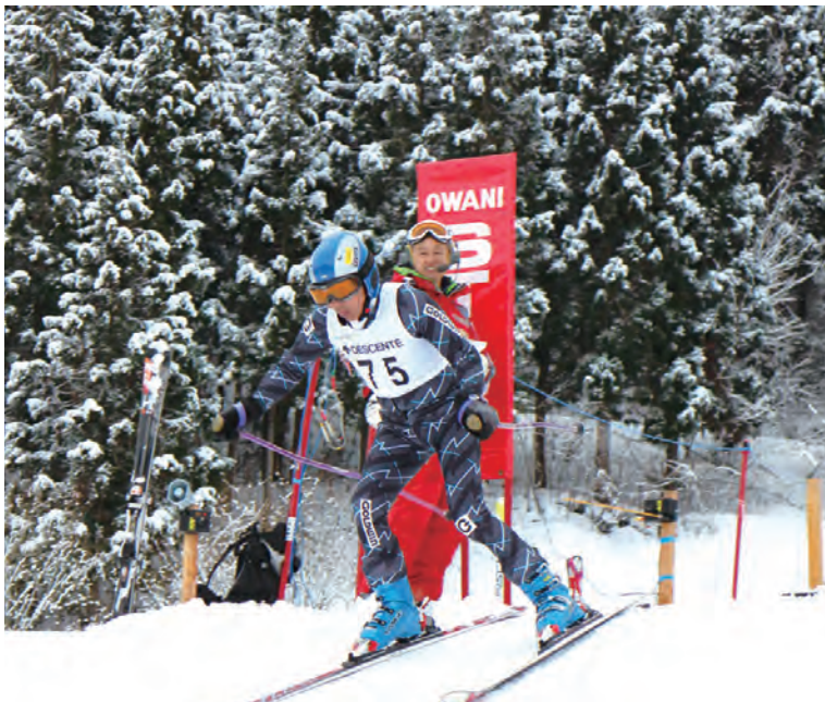
大鰐温泉スキー場にて